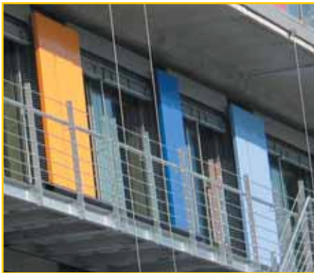
Bunte Platten markieren die Löcher des Sonnenschiffs: Im Sommer lassen sie die Nachtkühle hinein.

Als erster Mieter breitete sich im Juli die Geschäftsstelle des Öko-Instituts auf fünf Etagen des Sonnenschiffs aus. Wenn die 45 Mitarbeiter an einem heißen Sommernachmittag ihre Schreibtische verlassen, öffnen sie raumhohe Türen an der Außenwand, welche die ganze Nacht offen bleiben und die Wärme nachhaltig aus den Etagen vertreiben – Wände und Böden sind so ausgelegt, dass sie die Kühle für den folgenden Tag speichern können.