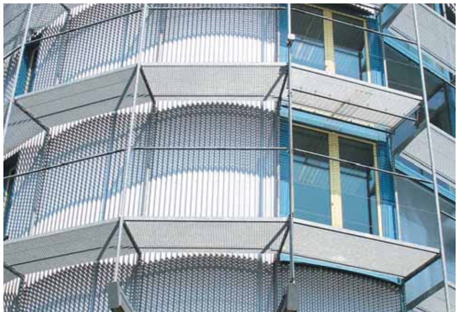
Ein Haus in Form einer Dose: Das Heliotrop dreht sich, um je nach Jahreszeit mehr oder weniger Sonne herein zu lassen.