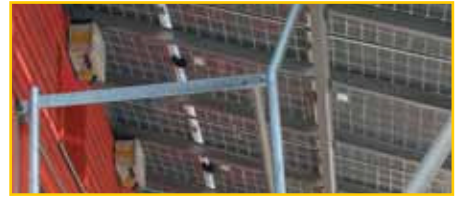
Solarzellen bilden die Dächer der Solarsiedlung am Freiburger Schlierberg.

Im Winter soll ein Lüftungssystem mit Wärmerückgewinnung in Verbindung mit den aus VIPs und fünf Zentimeter dickem Spezialglas bestehenden Fassaden dafür sorgen, dass der Heizbedarf auf ein Zehntel dessen sinkt, was sonst für Bürogebäude üblich ist.